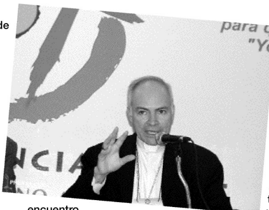
Mons. Carlos Aguiar Retes, presidente de la CEM

«El itinerario de los discípulos misioneros» es el quinto tema en el que se tocan estos argumentos: «la espiritualidad trinitaria; Cristo camino, verdad y vida; docilidad al Espíritu Santo; lugares y momentos de